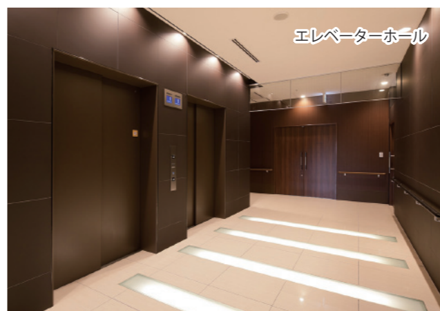
エレベーターホール